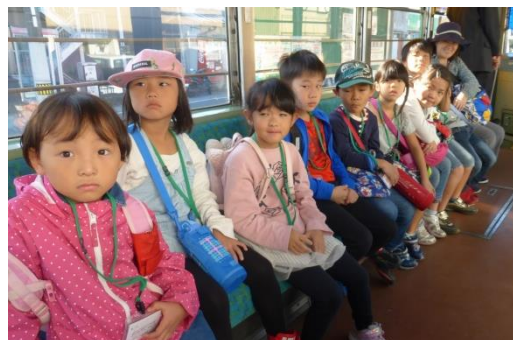
西山・小高坂児童館の皆さん

長年にわたる活動が認められ 平成28年度地球温暖化防止活動環境大臣表彰 「環境教育活動部門」を受賞しました