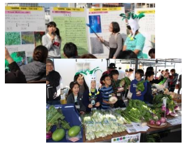
高知市立潮江東小学校の皆さん