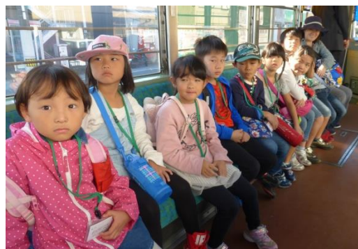
西山・小高坂児童館の皆さん

長年にわたる活動が認められ 平成 28 年度地球温暖化防止活動環境大臣表彰 「環境教育活動部門」を受賞しました