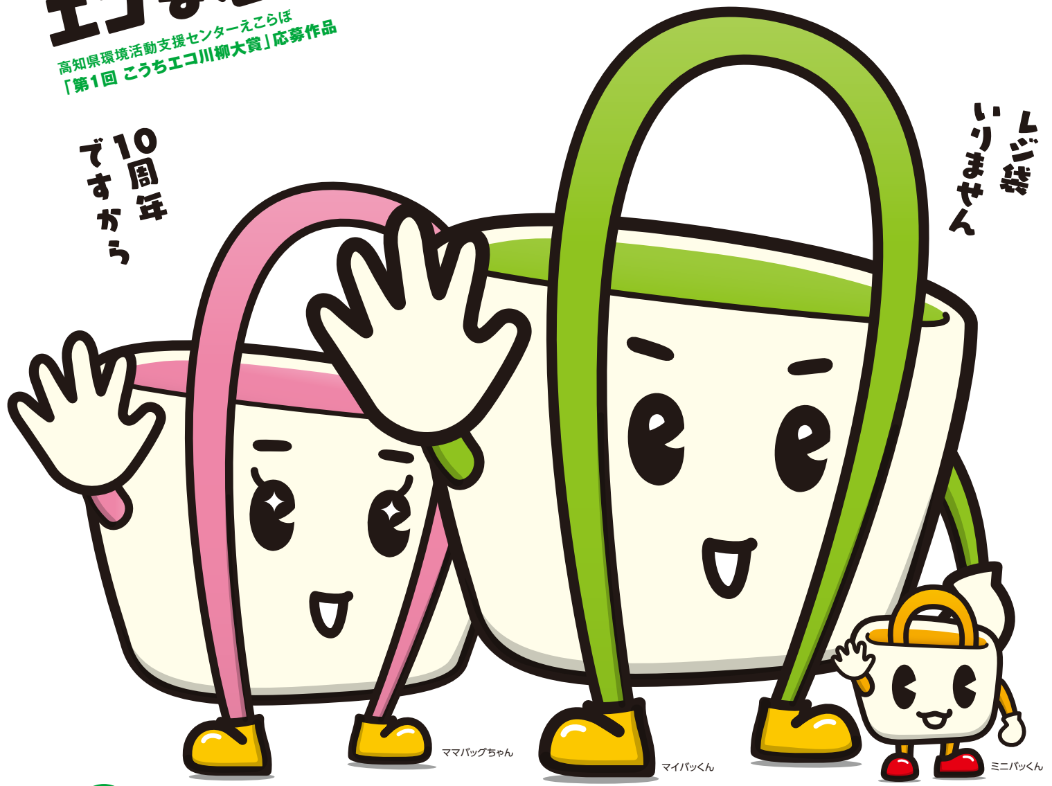
ママバッグちゃん